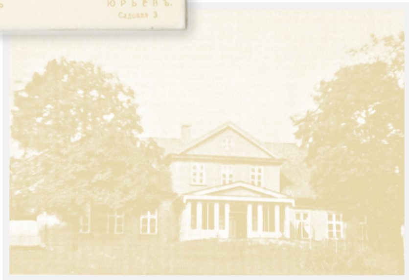
Akenstakas ( Klingenberg ) muižas kungu nams, kurā dzimis grāmatas autors 1886. gada foto