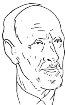
Rīgas domes priekšsēdētājs K. Dēķens