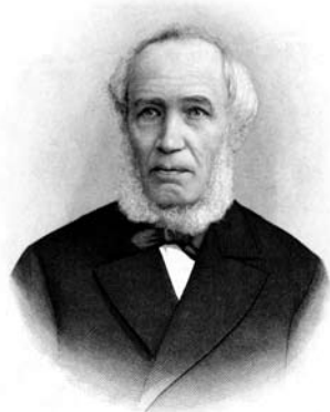
Roberts fon Bīngners – Rīgas pilsētas galva (1878–1886).

Dzimtbūšanas atcelšana, 1861. gada 22. novembrī pieņemtais ukazs par tirdzniecības brīvību, 1866. gada 4. jūnijā valdības lēmums par amatnieciskās un rūpnieciskās ražošanas brīvību sekmēja jaunu ekonomisko attiecību veidošanos valstī, kā arī latviešu un krievu tautības