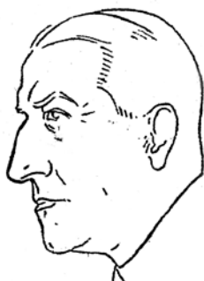
Vācu frakcijas vadītājs V. Pussuls