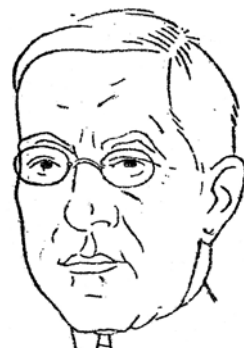
Nacionālas apvienības frakcijas vadītājs A. Bergs