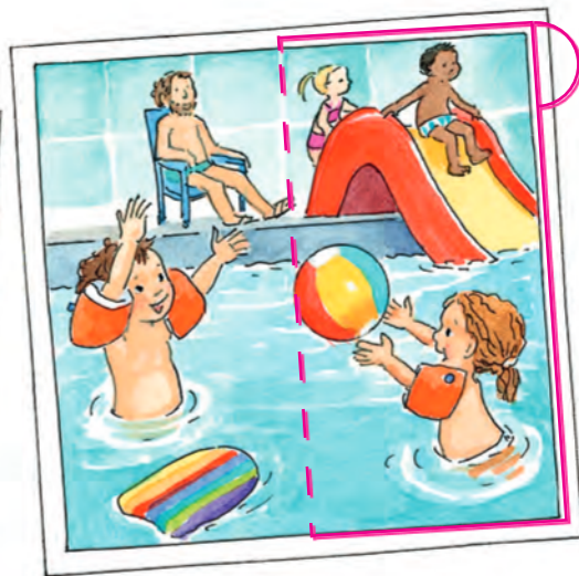
Piektdien Liza un Pauls iet uz peldbaseinu.