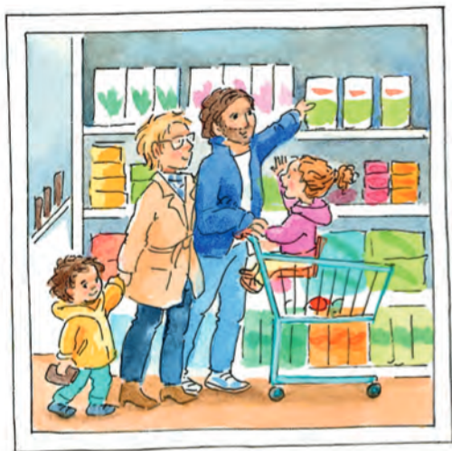
Sestdien ir nedēļas nogale. Tad Zundelu ģimene brauc iepirkties.