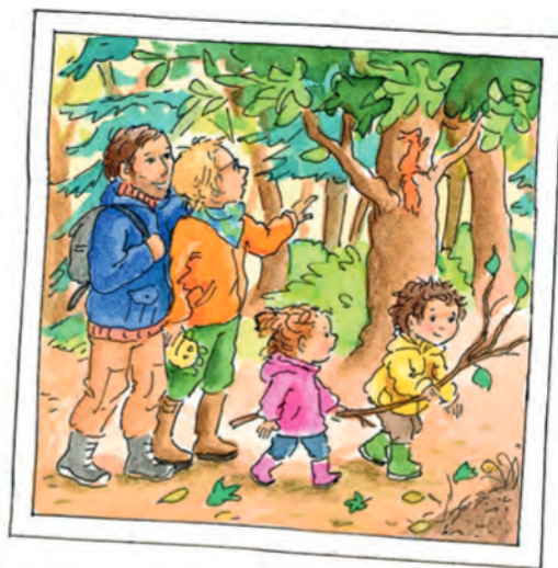
Ja ir labs laiks, svētdien ģimene dodas ekskursijā.