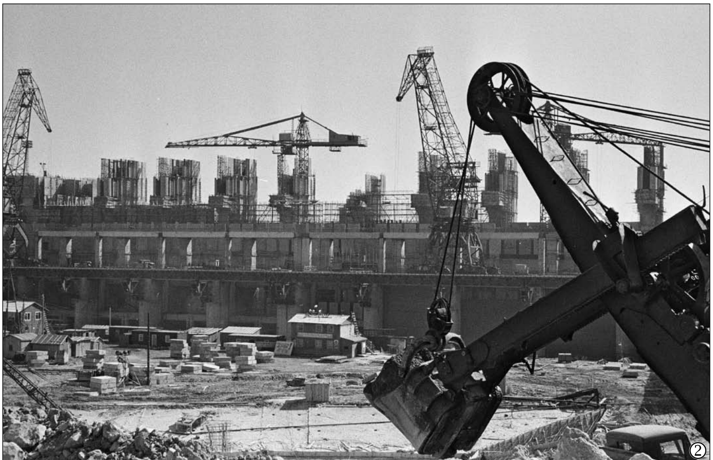
1. Ceļā uz Pļaviņu HES celtniecības sākumu. 1961. gads 2.-3. Pļaviņu HES būve. 1965. gads