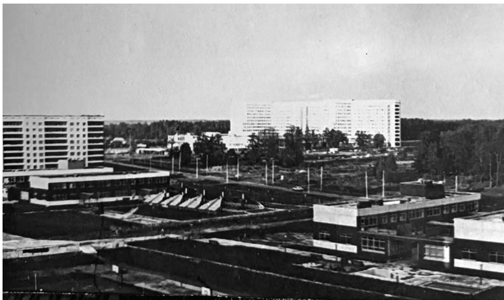
Skats no augšas uz Gailezera slimnici un bērnudārzu. 1980