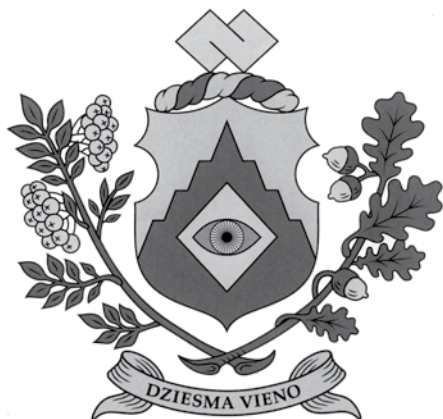
Actiņu dzimtas ģerbonis