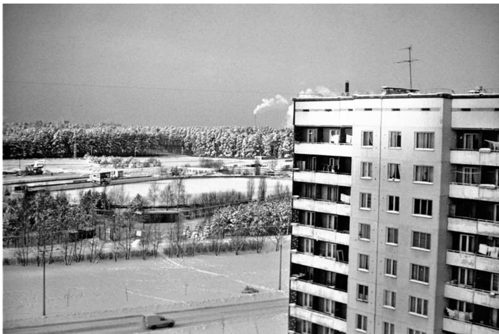
Skats no Mežciema dzīvokļa loga ziemā. Tālumā stadions, Biķernieku mežs un TEC-1 kūpošie skursteņi